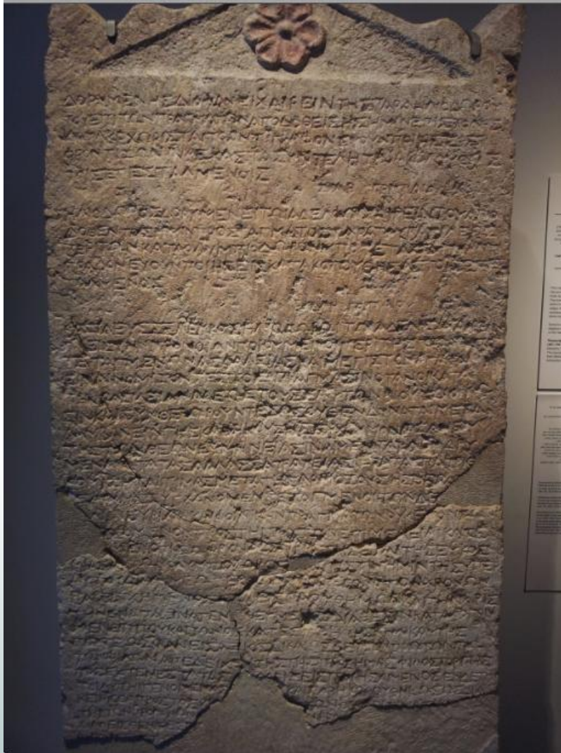
כתובת הליודורוס, 178 לפנ', מוסיאון ישראל