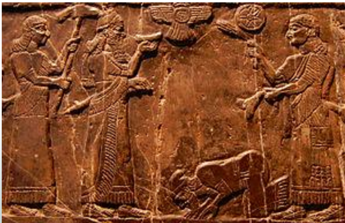
יהוא מלך ישראל משתחוה בפני שלמנאסר השלישי (ויקיפדיה), British Museum